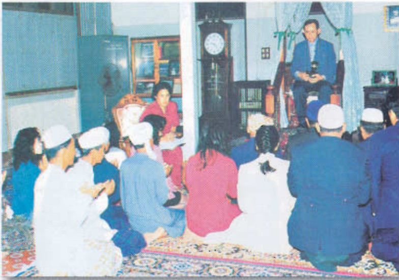
ทรงพระราชทานพระบรมราโชวาทแก่ผู้นำศาสนาอิสลาม ได้เห็นความ สำคัญของภาษาไทยในการดำรงชีวิตและความเข้าใจในชนชาติเดียวกัน