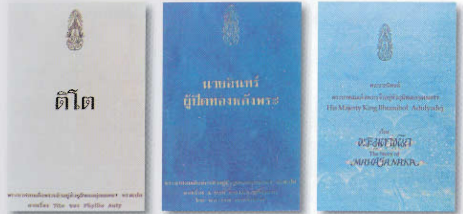
งานพระราชนิพนธ์ส่วนหนึ่งของพระบาทสมเด็จพระเจ้าอยู่หัว ซึ่ง แต่ละเรื่องสะท้อนให้เห็นถึงพระราชอัจฉริยภาพในด้านภาษาและวรรณศิลป์