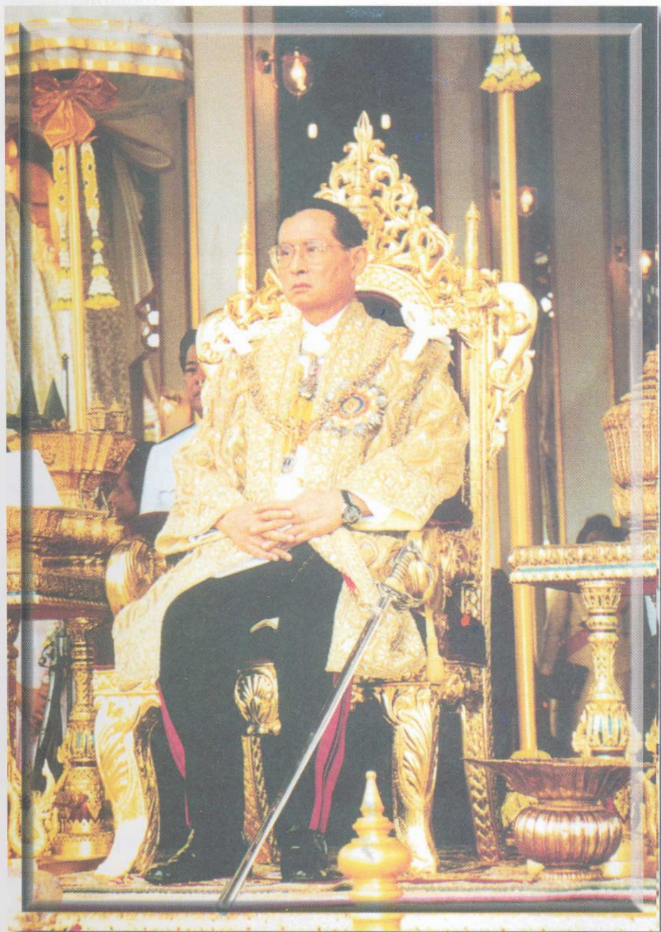
พระบาทสมเด็จพระปรมินทรมหาภูมิพลอดุลยเดช