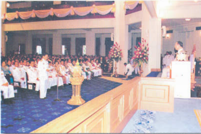
ทรงร่วมอภิปราย เรื่อง “ปัญหาการใช้ภาษาไทย” ที่คณะอักษรศาสตร์ จุฬาลงกรณ์มหาวิทยาลัย เมื่อวันที่ ๒๙ กรกฎาคม ๒๕๐๕