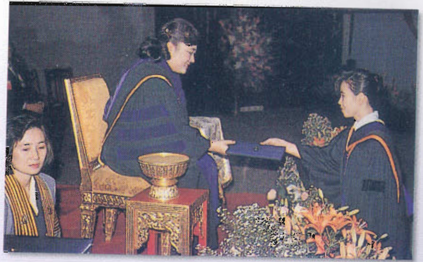
เสด็จประทานปริญญาบัตรแก่ผู้สำเร็จการศึกษาสาขาวิชาพยาบาลศาสตร์