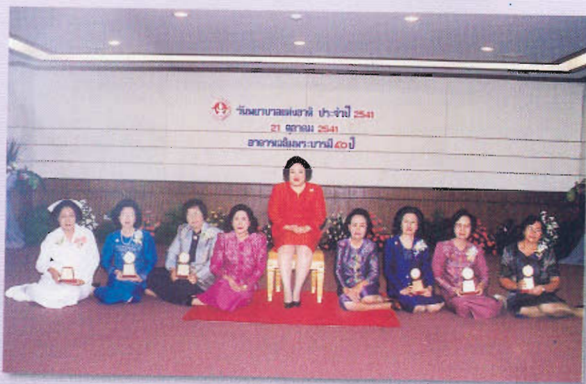
เสด็จงานวันพยาบาลแห่งชาติ