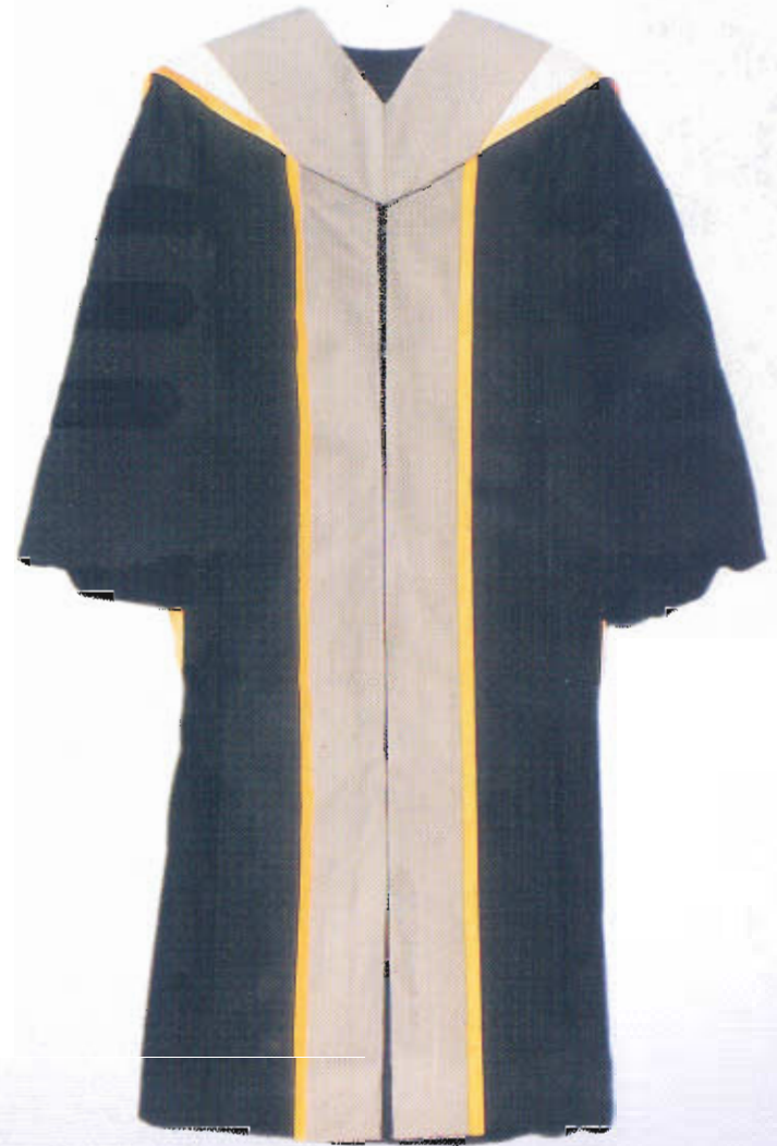
ฉลองพระองค์ครู พยาบาลศาสตรดุษฎีบัณฑิตกิตติมศักดิ์