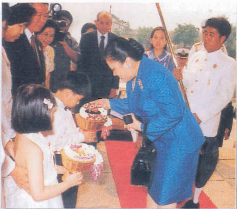
ทรงเป็นประธานงานประกวดสุขภาพเด็กงานกาชาด