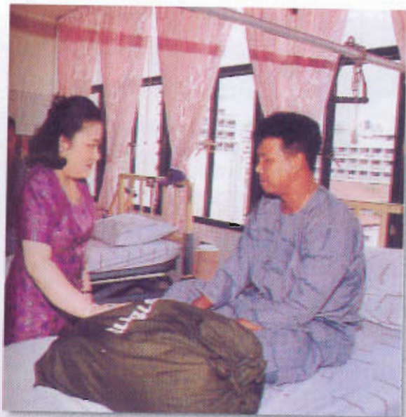
ทรงเยี่ยมและประทานของให้แก่ทหารและตำรวจที่เจ็บป่วยในโรงพยาบาล