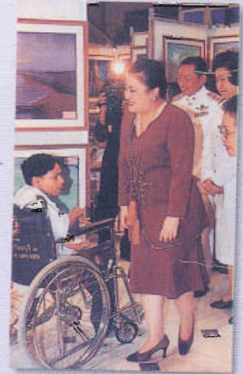
ทรงเปิดงานนิทรรศการภาพเขียนเด็กพิการ