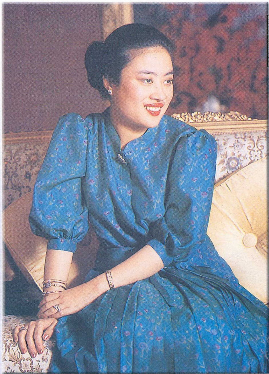
พระเจ้าวรวงศ์เธอ พระองค์เจ้าโสมสวลี พระวรราชาทินัดดามาตุ