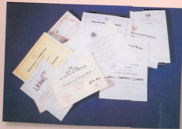
ส่วนหนึ่งของปริญญากิตติมศักดิ์ ที่พระองค์ทรงได้รับจากมหาวิทยาลัยในต่างประเทศ