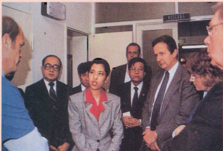
ทรงเป็นอาจารย์พิเศษ สาขาวิชาเคมี ของมหาวิทยาลัยทั้งในประเทศ และต่างประเทศ