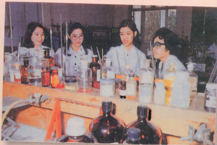
ทรงทดสอบความกระด้างของน้ำด้วยวิธีไทเทรต