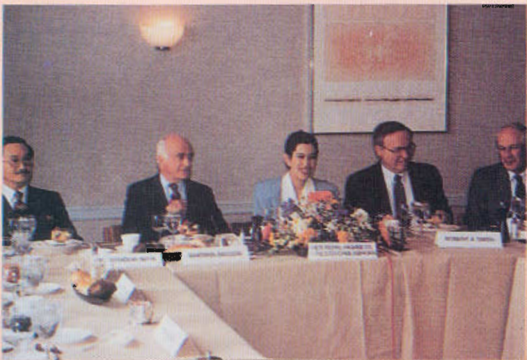
ทรงเป็นองค์ประธานกิตติมศักดิ์ โครงการสิ่งแวดล้อมแห่งสหประชาชาติ