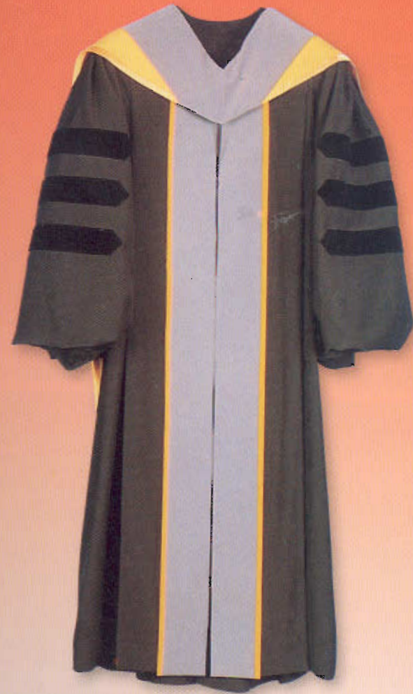
ฉลองพระองค์ครุย วิทยาศาสตรดุษฎีบัณฑิตศึกษาศึกษา สาขาวิชาเคมี