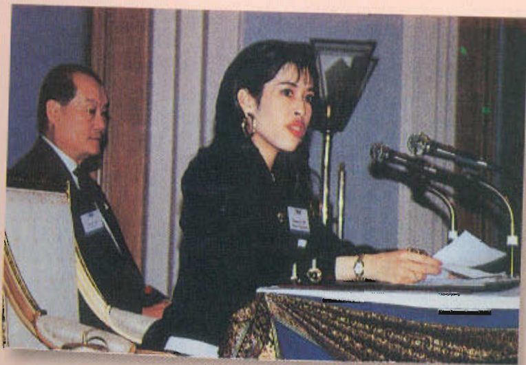
ทรงก่อตั้งและดำรงตำแหน่งประธานสถาบันวิจัยจุฬาภรณ์ (Chulabhorn Research Institute)