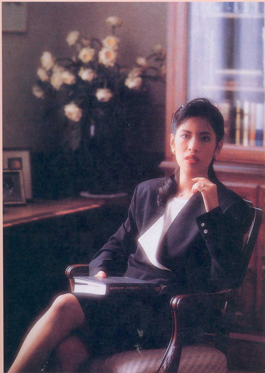
ศาสตราจารย์ ดร.สมเด็จพระเจ้าลูกเธอ เจ้าฟ้าจุฬาภรณวลัยลักษณ์ อัครราชกุมารี