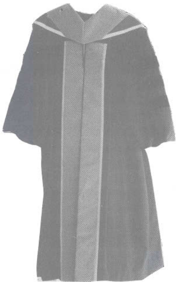
ฉลองพระองค์ครู ศิลปกรรมศาสตรดุษฎีบัณฑิตกิตติมศักดิ์ สาขาวิชานฤมิตรศิลป์