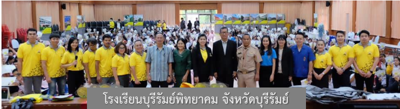
โรงเรียนบุรีรัมย์พิทยาคม จังหวัดบุรีรัมย์