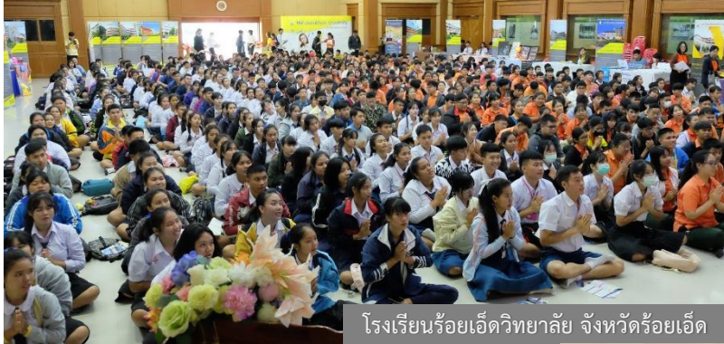
โรงเรียนร้อยเอ็ดวิทยาลัย จังหวัดร้อยเอ็ด