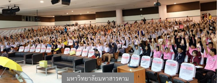
มหาวิทยาลัยมหาสารคาม

กองบริการการศึกษา มหาวิทยาลัยมหาสารคาม จัดกิจกรรมแนะแนวการศึกษาในระดับปริญญาตรี ประจำปีการศึกษา 2563 สำหรับผู้บริหารสถาบันการศึกษา ครูแนะแนว และนักเรียนชั้นมัธยมศึกษาปีที่ 6 ในเขตพื้นที่ภาคตะวันออกเฉียงเหนือ จำนวน 20 จังหวัด ในการจัดกิจกรรมแนะแนวการศึกษาครั้งนี้ ประกอบด้วยบุคลากรกองบริการการศึกษา พร้อมด้วยตัวแทนแต่ละคณะร่วมแนะแนวการศึกษา การจัดกิจกรรมในครั้งนี้มีวัตถุประสงค์เพื่อให้ผู้เข้าร่วมโครงการได้ทราบข้อมูลเกี่ยวกับหลักสูตรการศึกษา คณะ/วิทยาลัย/สาขา ที่เปิดสอน วิธีการรับเข้าศึกษา การสมัคร เกณฑ์การคัดเลือก ในระดับปริญญาตรี มหาวิทยาลัยมหาสารคาม ประจำปีการศึกษา 2563 และเพื่อเป็นการเตรียมความพร้อมสำหรับนักเรียนและผู้สนใจที่จะเข้าศึกษาต่อมหาวิทยาลัยมหาสารคาม อีกทั้งเพื่อให้ได้ผู้เรียนที่มีความรู้ความสามารถและความถนัดตรงตามสาขาวิชาที่เรียนมากที่สุด สำหรับผู้สนใจเข้าศึกษาในระดับปริญญาตรี มหาวิทยาลัยมหาสารคาม สอบถามรายละเอียดเพิ่มเติมได้ที่ กองบริการการศึกษา 043-754377 หรือ 043754333 ต่อ 1201-1204 เว็บไซต์ https://admission.msu.ac.th/ และแฟนเพจ เรียนต่อ มมส Mahasarakham university