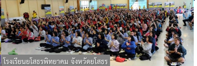
โรงเรียนยโสธรพิทยาคม จังหวัดยโสธร