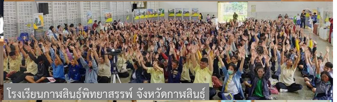
โรงเรียนกาฬสินธุ์พิทยาสรรพ์ จังหวัดกาฬสินธุ์