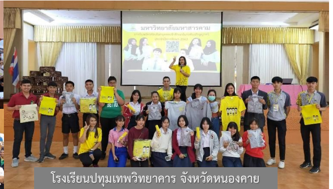
โรงเรียนปทุมเทพวิทยาคาร จังหวัดหนองคาย