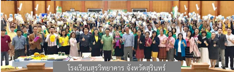
โรงเรียนสุรวิทยาคาร จังหวัดสุรินทร์