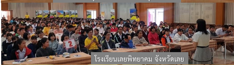
โรงเรียนเลยพิทยาคม จังหวัดเลย