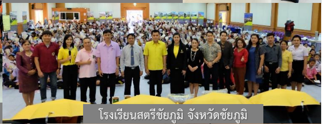
โรงเรียนสตรีชัยภูมิ จังหวัดชัยภูมิ