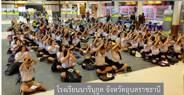
โรงเรียนนารีนุกูล จังหวัดอุบลราชธานี