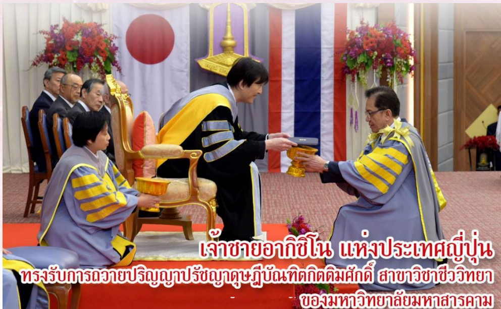
เจ้าชายอากิฮิโตะ แห่งประเทศญี่ปุ่น ทรงรับการถวายปริญญาปรัชญาดุษฎีบัณฑิตกิตติมศักดิ์ สาขาวิชาชีววิทยา ของมหาวิทยาลัยมหาสารคาม

ฉบับที่ 39 ประจำเดือน กันยายน – ธันวาคม 2561