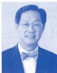
ม.ร.ว.ปรีดิยาธร เทวกุล

มหาวิทยาลัยมหาสารคาม ประกาศยกย่อง เชิดชูเกียรติบุคคลที่สร้างคุณงามความดีและ ทำคุณประโยชน์ให้แก่ประเทศชาติ โดยรับรางวัล พระราชทานพระธาตุนาดูนทองคำ จำนวน 4 คน ได้แก่